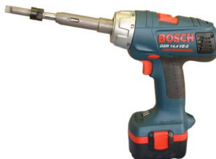
VALVA - с аккумулятором