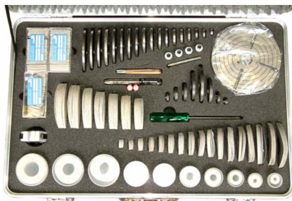
Принадлежности к станку VALVA-1 в чемодане