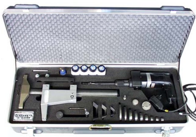
Станок VALVA-1 в чемодане

Станки VALVA образуют - как вся продукция фирмы EFCO - комплектную ремонтную систему.