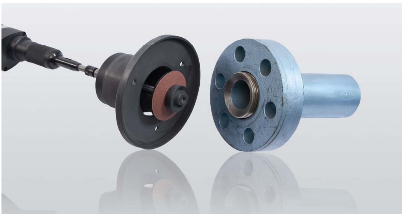
EFCO-LS с направляющей гильзой

Благодаря применению специальных точных направляющих гильз возможна абсолютно центрическая обработка уплотнительной поверхности. Для малых номинальных диаметров используются направляющие гильзы. При обработке труб больших номинальных диаметров применение специального зажимного патрона обеспечивает абсолютно точное ведение шлифовального инструмента.