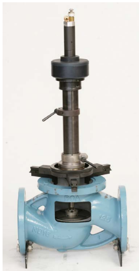
TSV-150 с зажимным патроном (с пневмоприводом)

Благодаря использованию эксцентрика снимается влияние различных окружных скоростей реза. Результат обработки – плоская уплотнительная поверхность.