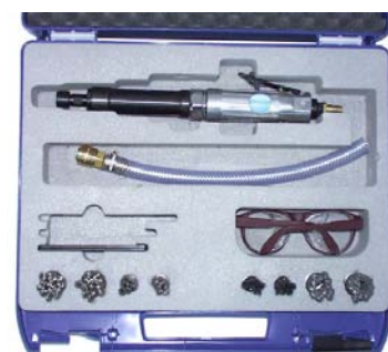
ARS – в чемодане с пневмоприводом