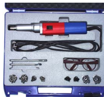
ARS – в чемодане с электроприводом